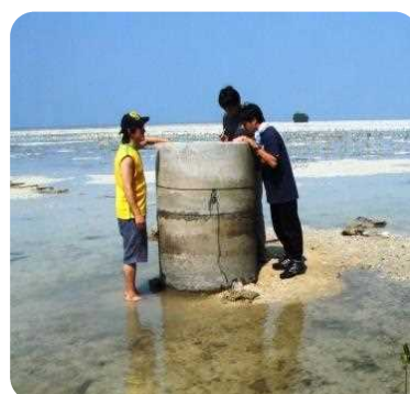
油分解菌を狙っています