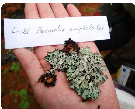
新属株の分離源となった地衣類