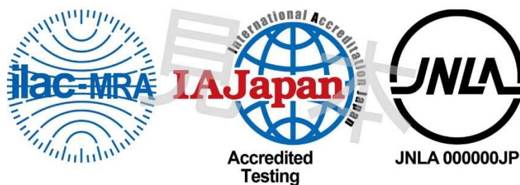
図1 ILAC MRA 組み合わせ認定シンボル

備考:ILAC MRA マークは ILAC により国際商標登録されている。(国際登録番号:840857)