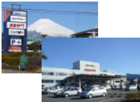
開催会場外観(ショッピングモール)