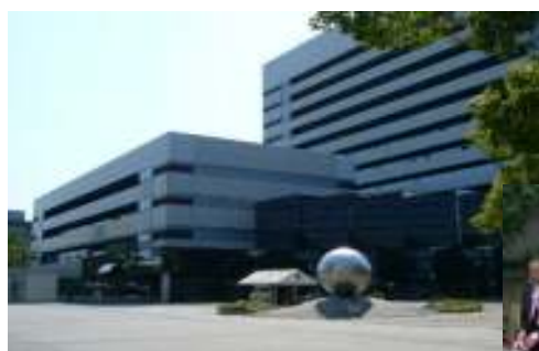
春日井市役所1階市民ホール (春日井市鳥居松町5-44)