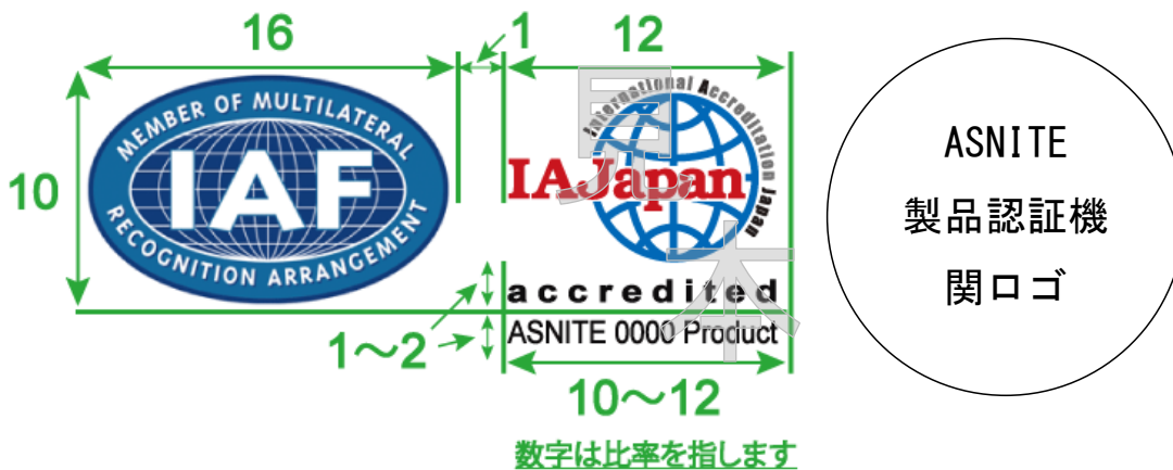
図 2 ASNITE/IAF MLA組み合わせ認定シンボルの使用例

※：認定センターはIAF MLAメインスコープ（製品認証）におけるIAF MLA署名認定機関であり、ASNITE/IAF MLA組み合わせ認定シンボルは、ASNITE製品認証機関ロゴと組み合わせて使用すること。