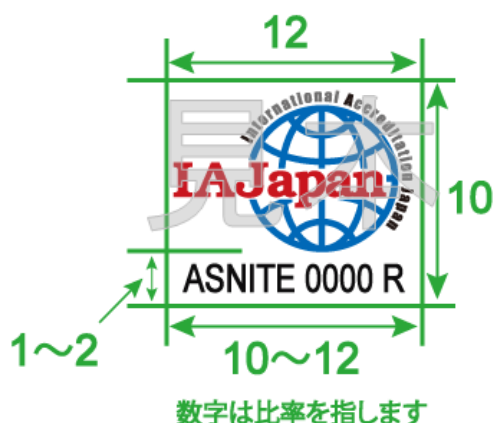
図3 ASNITE標準物質生産者が認証書等に表示できる認定シンボルの比率

がめたり、回転させて使用してはならない。また、IAJapan の文字及び認定番号は読み取れる大きさ以上とし、認定シンボルが識別できないような背景で使用してはならない。