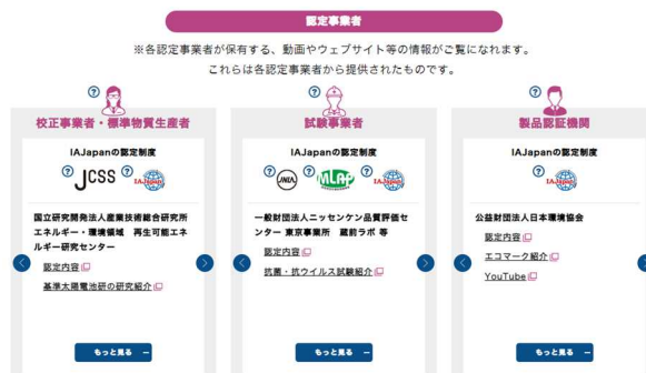
<認定事業者のお仕事紹介ページ>