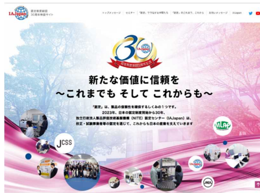
<特設サイトトップページ>