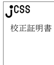
jcssl標準章付校正証明書