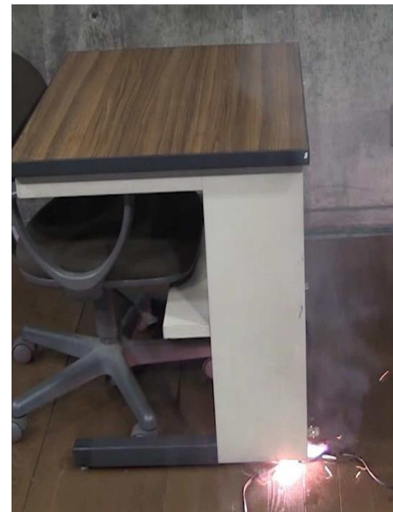
【NITEの再現実験】机の脚に踏み付けられていたコードから発火