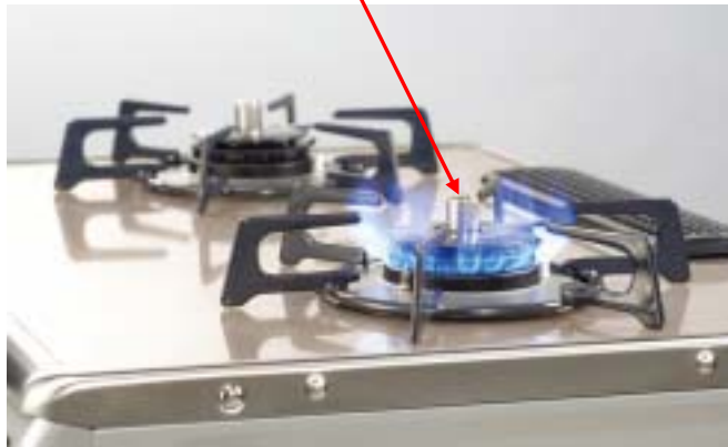
調理油過熱防止装置