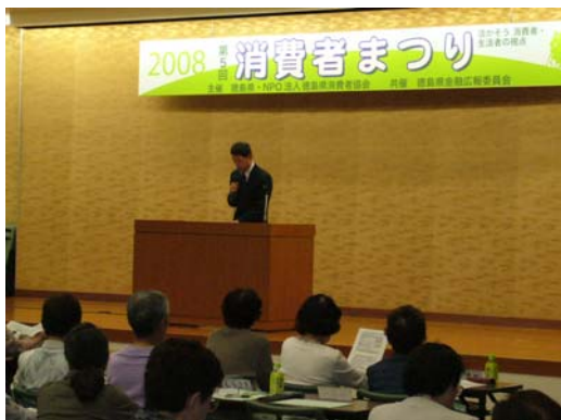
メイン会場講演(局・岡本氏)