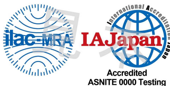
図1 ILAC MRA組み合わせ認定シンボル

備考: ILAC MRAマークはILACにより国際商標登録されている。(国際登録番号: 840857)