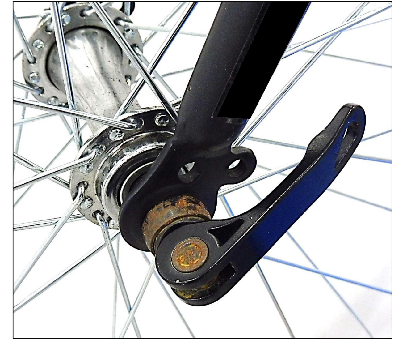
(写真)クイックリリースレバー