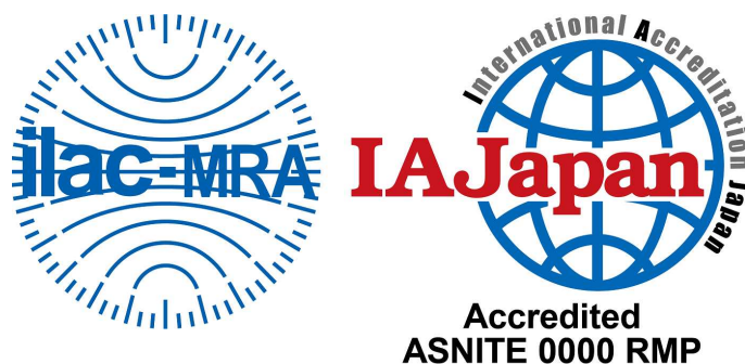
図1 ASNITE 標準物質生産者認定シンボル

認定事業者がその認定の地位を示すことに用いるために、IAJapanによって交付されるシンボル。認定機関ロゴに、認定識別を加えた一体のもので構成される。認定シンボルは認定事業者が発行するRM文書(“標準物質認証書”又は“製品情報シート”)に使用することができる(下図1参照)。