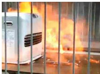
再現映像 熱によるスプレー缶の破裂

( https://www.youtube.com/watch?v=zTbySsjDe5A )