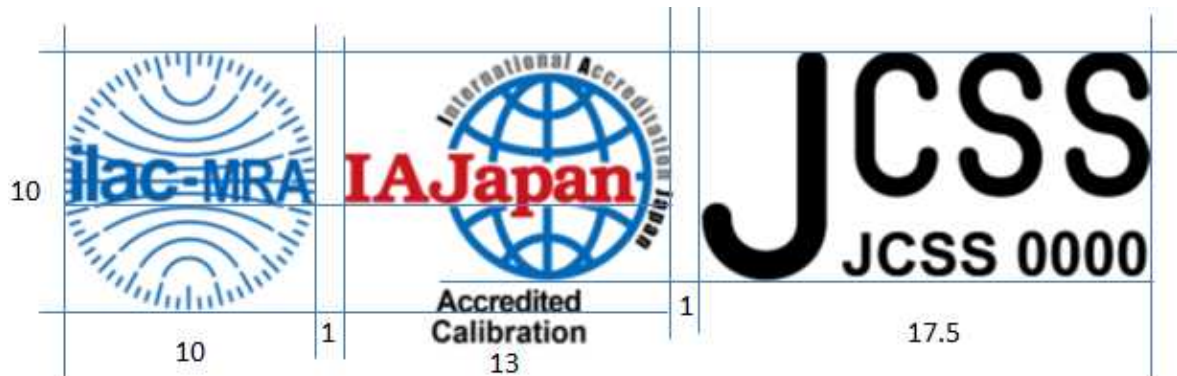
図4 JCSS/ILAC MRA 組み合わせ認定シンボル

IAJapanと認定契約を締結した認定事業者が使用できる認定シンボル及びMRA/MLA組み合わせ認定シンボルの使用例を図4から図11に示す。(図内数値は寸法比を表す)