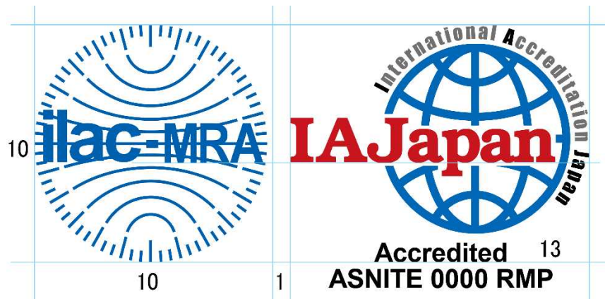
図9 ASNITE 標準物質生産者のシンボル