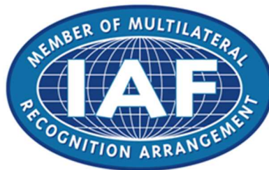
図3 IAF MLA マーク (国際登録番号:0848938)