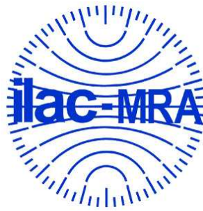
図2 ILAC MRA マーク(Blue version) (国際登録番号:840857)