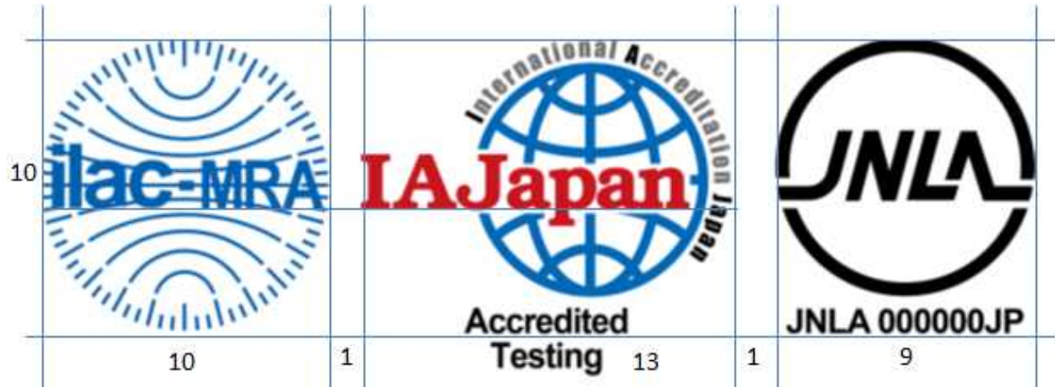
図5 JNLA/ILAC-MRA 組み合わせ認定シンボル