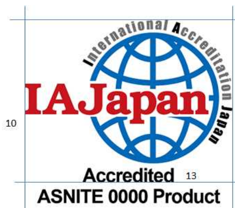
図11 ASNITE 製品認証機関の認定シンボル