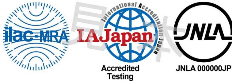
図1 ILAC MRA 組み合わせ認定シンボル

備考:ILAC MRA マークは ILAC により国際商標登録されている。(国際登録番号:840857)