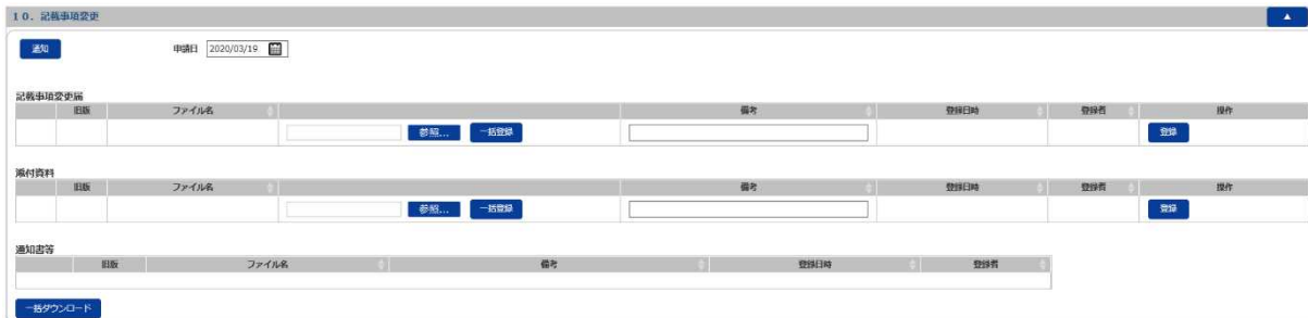
事業者案件対応画面「10. 記載事項変更」