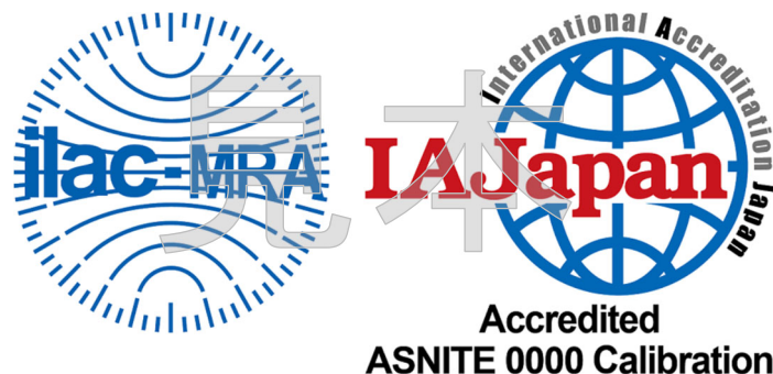
図1 認定事業者が使用できる認定シンボル

認定事業者は、認定された範囲について、図1のILAC MRA組み合わせ認定シンボルの使用及び認定要求事項に適合している旨の記載ができる。認定シンボルを使用する場合は、別に定める「IAJapan認定シンボルの使用及び認定の主張等に関する方針」に掲げる事項を遵守すること。