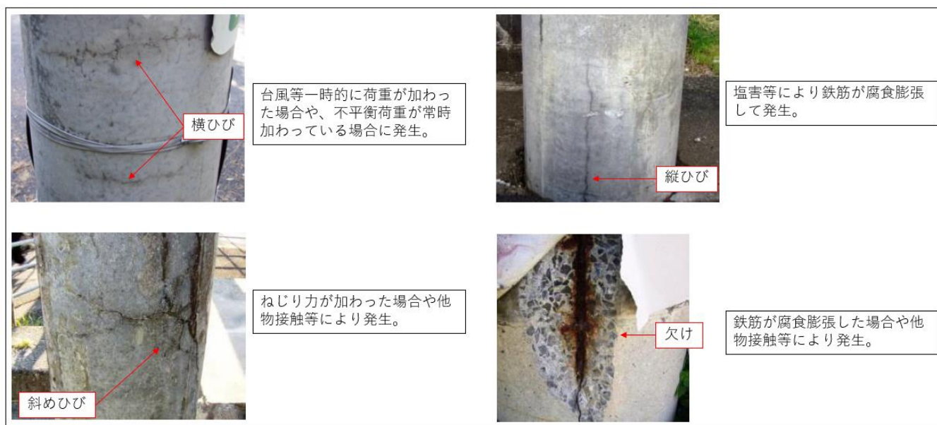
図4 鉄筋コンクリート柱のひび割れ例

電線路の経路を変更する、新たな電線路を追加する、看板等の装柱物を追加する等、電柱への荷重が変わる場合は、改めて電柱の強度を確認してください。また、必要な場合は支線等を設けてください。