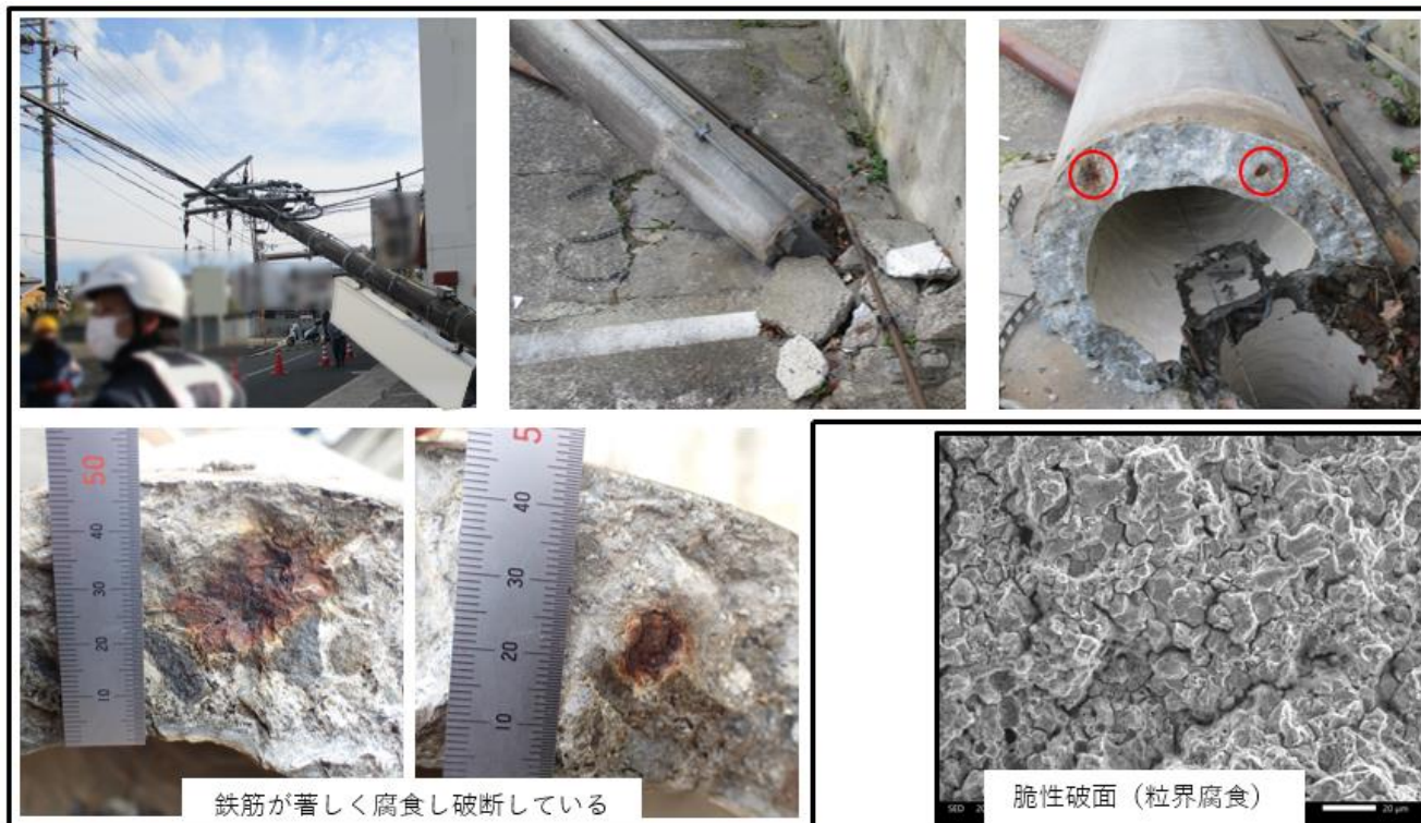
図1 鉄筋コンクリート柱倒壊事故現場 （事例2）

また、強度計算によると、架渉線の張力による曲げモーメントが鉄筋コンクリート柱の設計許容値以上となっていたことが判明しました。