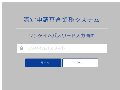
ワンタイムパスワード入力画面

付与された ID と、設定したパスワードを入力すると、ワンタイムパスワードの入力が要求されますので、メールで送られてくるワンタイムパスワードを入力してください。ワンタイムパスワードはログイン毎に発行され、システムご使用者様宛にメールで通知されます。ワンタイムパスワードの有効時間は 5 分です。